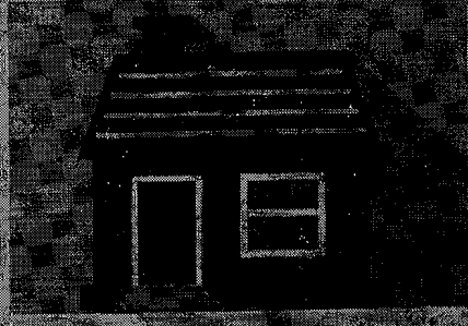
ฉบับเดือนนี้ ๓๖

โครงการสนับสนุนประชาชนผู้มีรายได้น้อย ให้สามารถมีที่อยู่อาศัยเป็นของตนเองได้