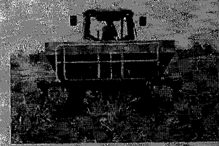
ฉบับเดือนนี้ ๓๓

การพัฒนาภาคเกษตรสมัยใหม่ สู่การขับเคลื่อนเศรษฐกิจของประเทศไทย