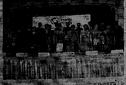
ฉบับเดือนนี้ ๓๖

สนับสนุนประชารัฐสมัยใหม่ ให้มีความเข้มแข็ง มีความสุข และมีรายได้เพิ่มขึ้น